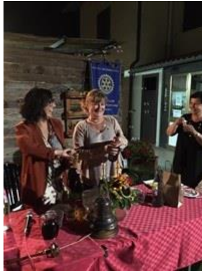
6 - Tantissime persone, hanno partecipato a questa festa dell'amicizia che ogni anno vede protagonista il nostro club con gli amici e le persone care.