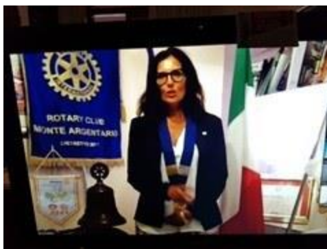
4 - Il 24 Luglio Letizia Cardinale, il nuovo governatore del distretto 2071, ha "virtualmente" visitato il nostro Club