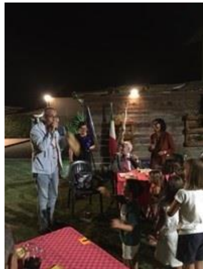
7 - Una lotteria ha chiuso la serata